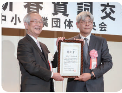
認定書を囲んで (左：埼玉県中小企業団体中央会 小谷野会長、右：飯田理事長)